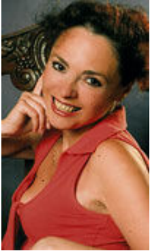
Iiona 43 Jahre