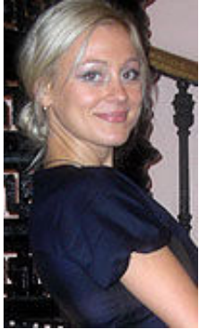
Daria 32 Jahre