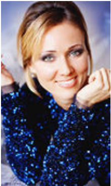
Daria 34 Jahre