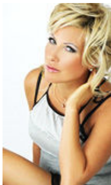
Marina 42 Jahre