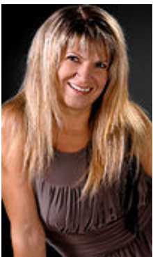
Nina 47 Jahre