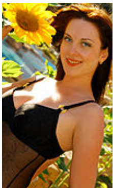
Daria 23 Jahre