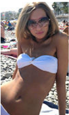
Val 20 Jahre