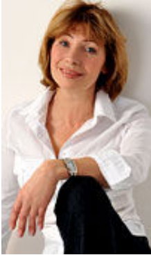
Tanita 51 Jahre