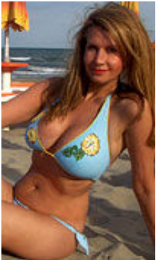
Lada 36 Jahre