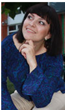
Alla 27 Jahre