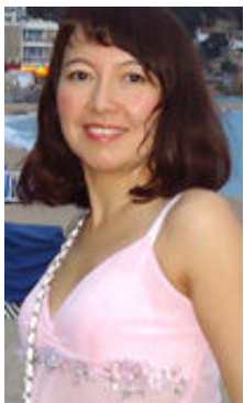
Mila 38 Jahre