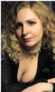
Alyona 33 Jahre