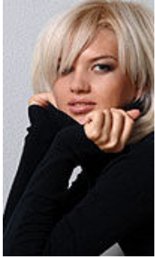
Nina 23 Jahre