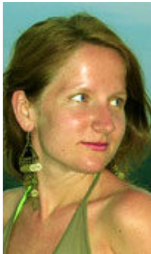
Iren 29 Jahre