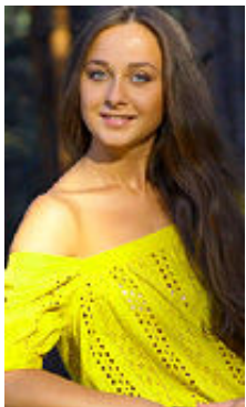
Vita 22 Jahre