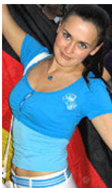
Venera 28 Jahre