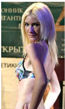
Nina 22 Jahre