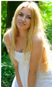
Marina 34 Jahre