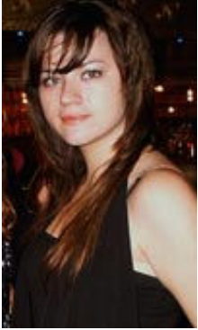
Marina 21 Jahre