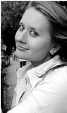
Victoria 34 Jahre