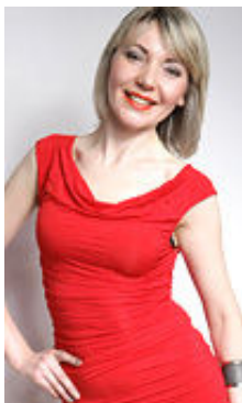
Marina 33 Jahre