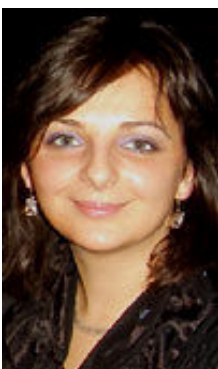
Klarika 31 Jahre