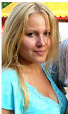
Nata 35 Jahre