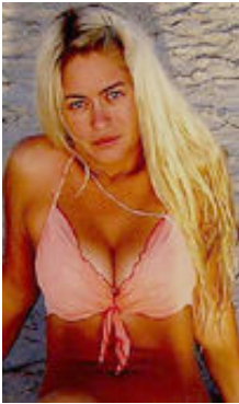
Marina 25 Jahre