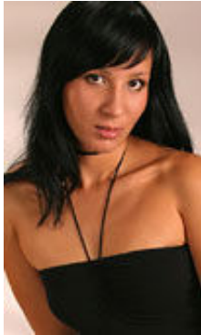
Raida 32 Jahre