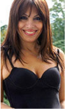
Mila 37 Jahre

Izabella (IZV684) aus Stavropol (Russland) - InterFriendship