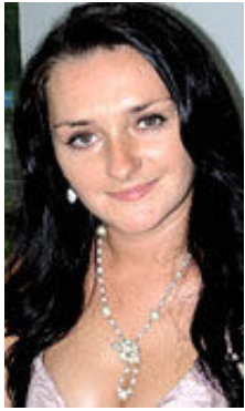
Marina 27 Jahre