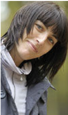
Marina 39 Jahre