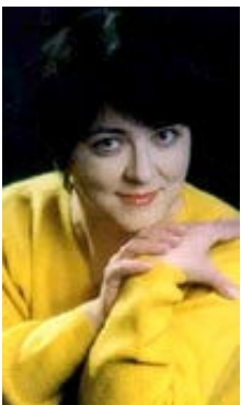
Marina 50 Jahre