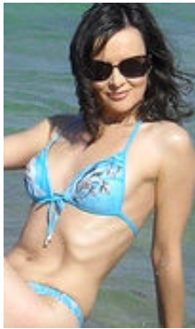
Victoria 40 Jahre