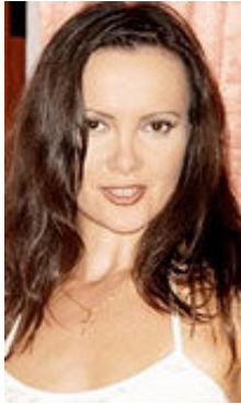
Victoria 40 Jahre