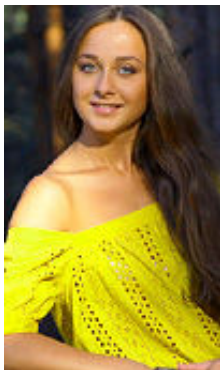
Vita 22 Jahre