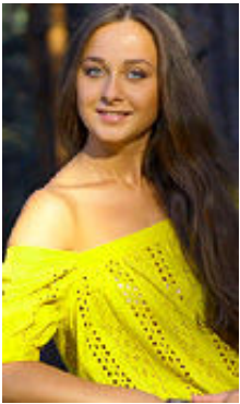
Vita 22 Jahre