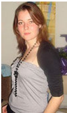
Alla 24 Jahre