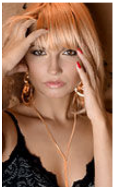
Rasina 34 Jahre