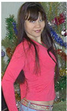
Gala 42 Jahre