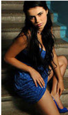
Vitalia 25 Jahre