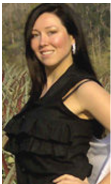
Venera 36 Jahre