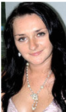
Marina 27 Jahre